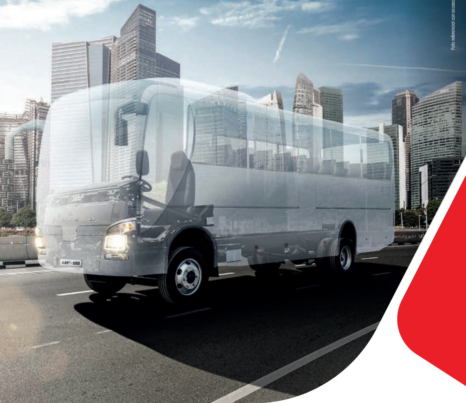
Foto referencial con accesorios.